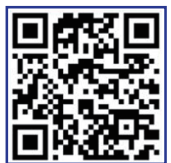
참여 신청서 접수